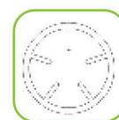
Ствол с рассекателями потока